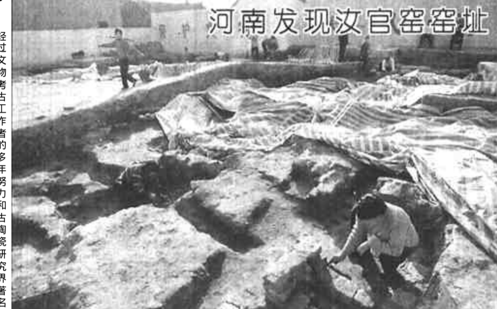
河南发现汝官窑窑址

经过文物考古工作者的多年努力和古陶瓷研究专家的论证，被中外考古学界寻觅半个多世纪的汝官窑窑址，终于在河南省宝丰县清凉寺得到确认。清凉寺汝官窑窑址的发掘，已出土大批青瓷、白瓷、瓷片及完整的瓷器。汝官窑窑址的发掘，是我国陶瓷考古史上又一重大发现。图为宝丰清凉寺汝官窑窑址发掘现场。