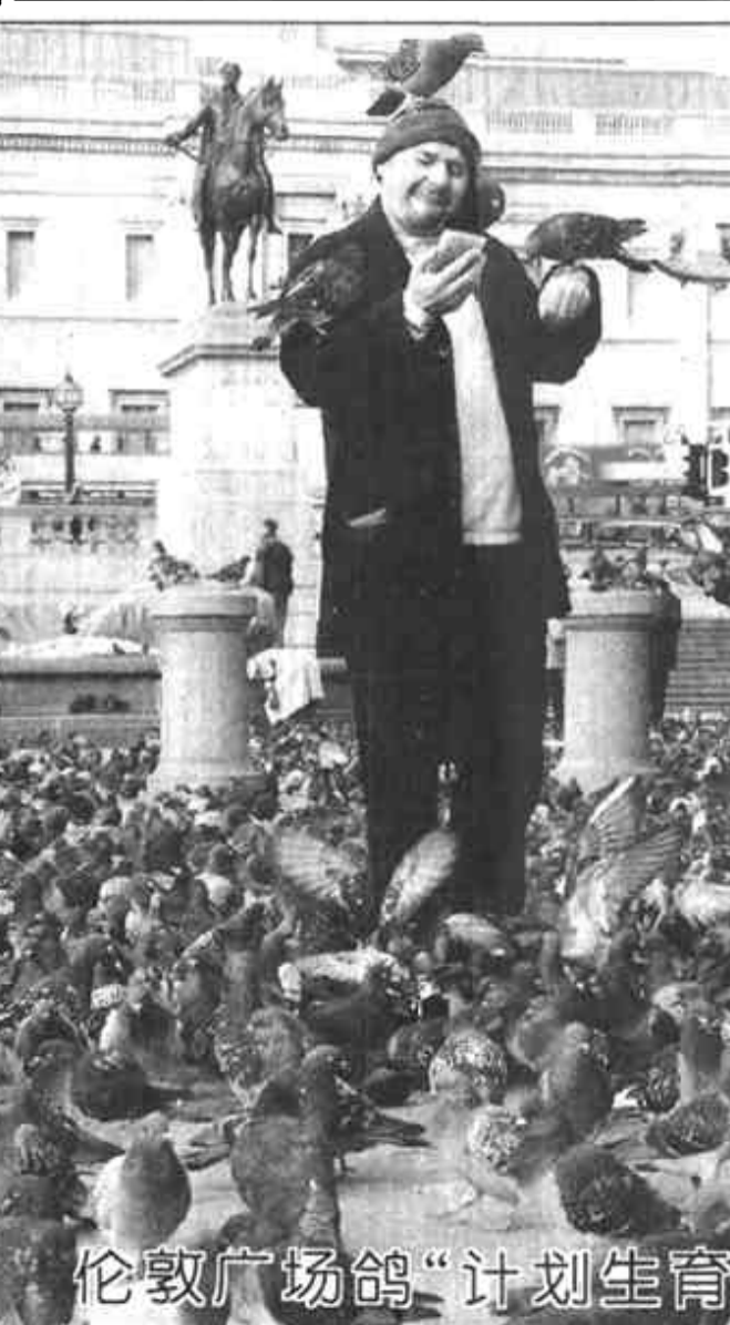
伦敦广场鸽“计划生育”